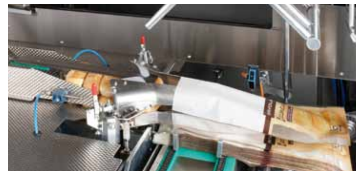
Slicing and packaging systems for the baking industry.